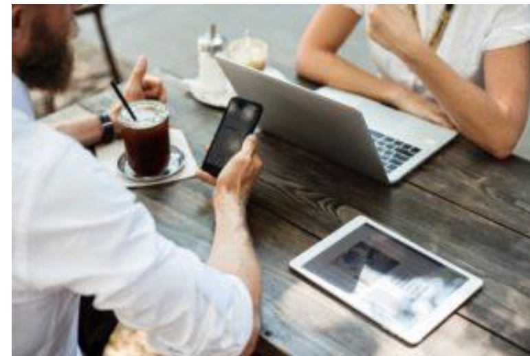
Obr. 6: Nástup na nové pracoviště