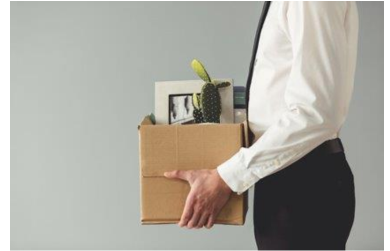
Obr. 5: Ukončení pracovního poměru