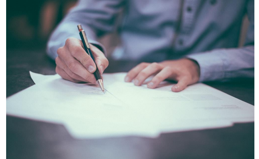
Obr. 2: Podpis smlouvy