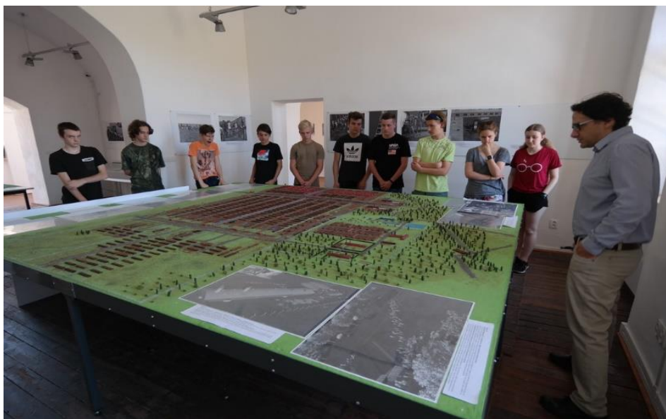
Výklad u fyzického modelu vyhlazovacího tábora Osvětim-Březinka v prostorách Centra studií genocid Terezín