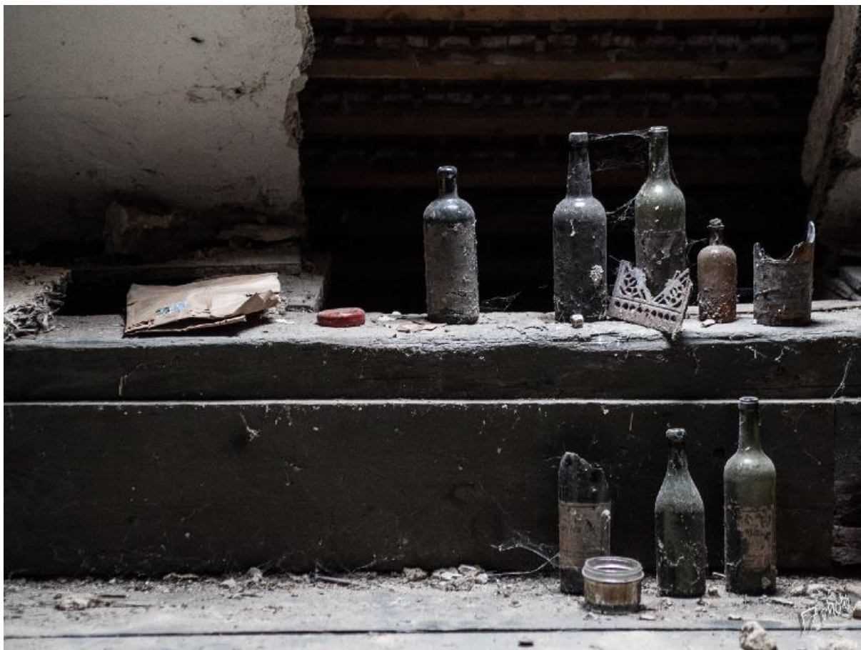
Foto: Historické relikty minulých staletí v podkroví (zdroj: TMZ)

Přitom je vše zaměřeno na prolínání času a vrstvení historických období. Nejde tedy primárně jen o to vyvolat v účastnících jednostranné vcítění se do osudů židovských vězňů. Vystavené předměty sahají daleko před události druhé světové války a všechny prošly rukama dnes dávno zmizelých lidí s vlastními osudy. Jde především o to, aby účastníci pochopili, že domy jsou jen kulisami historických událostí, které se mohou dramaticky proměňovat. Zde v nemocnici je to obzvláště patrné. Romantický nemocniční parčík plný stromů, květin a laviček v malebné době secese a počátku 20. století se za pár desetiletí změnil v zanedbané místo přeplněné nemocnými židovskými vězni bez základní zdravotní péče, kde se mnohdy odehrávaly ty nejtěžší osudy.