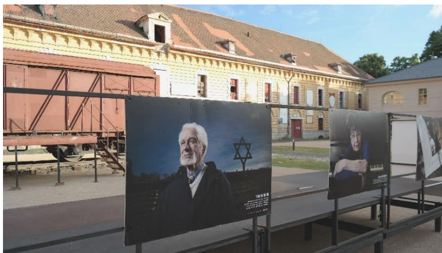
Fotografická výstava „Přeživší“ na nádvoří Dělostřeleckých kasáren u divadelního vagonu Vlaku Lustig v Terezíně