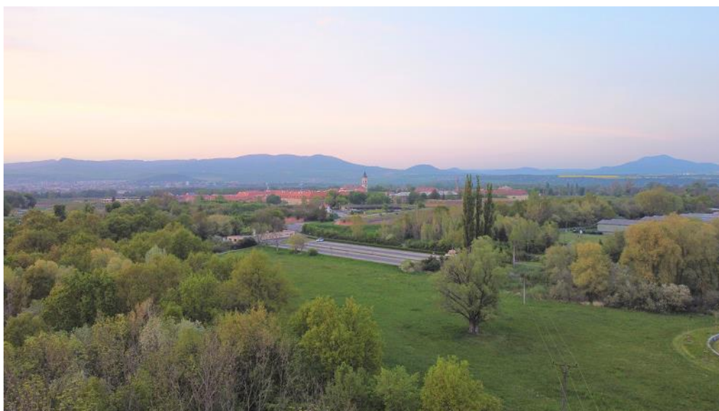
Foto: Bohušovická kotlina pohledem od pevnostního hřbitova (zdroj: TMZ)

Část fotografií byla pořízena až v pevnosti – u Bohušovické brány a v zatáčce u Hálkových sadů. Je možné zadat účastníkům úkol, aby pozorovali okolí a zkusili tato místa najít, až jimi budou procházet.