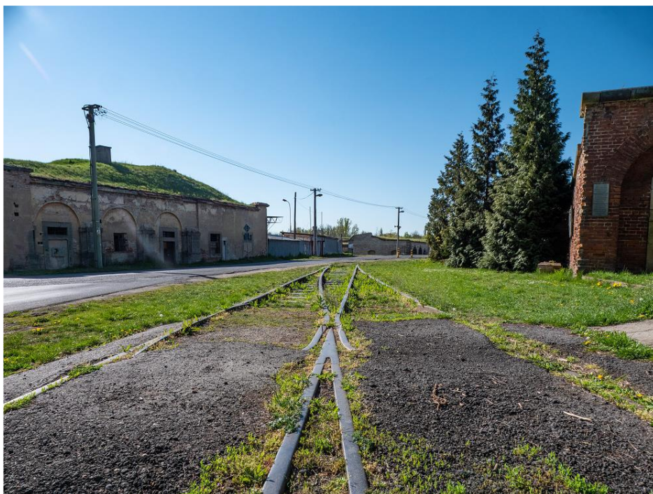
Foto: Pohled na vlečku a Bohušovickou bránu směrem z města