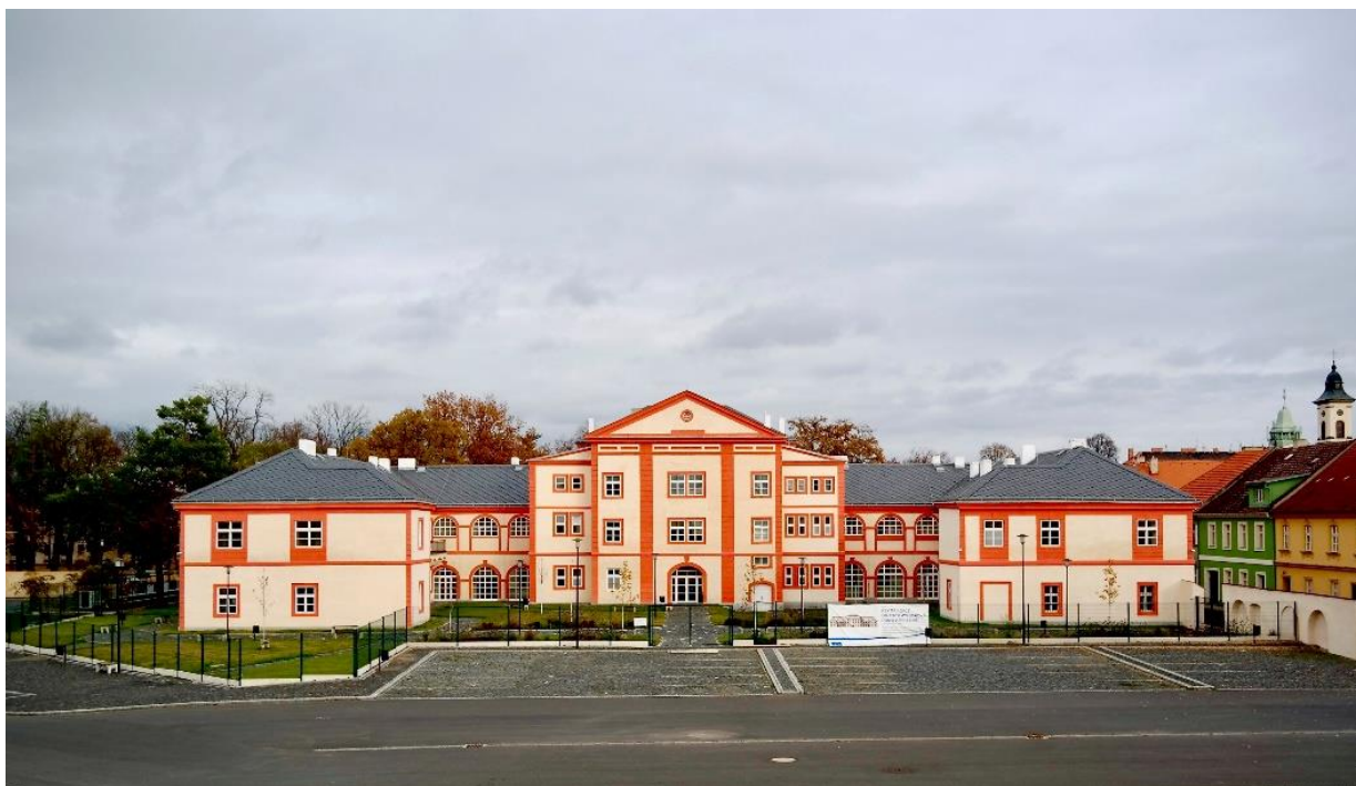
Nově zrekonstruovaný a pro vzdělávací účely plně vybavený Wieserův dům v Hlavní pevnosti v Terezíně, kde probíhá realizace tematického bloku č. 7 vzdělávacího programu Terezín v kontextu evropských dějin II