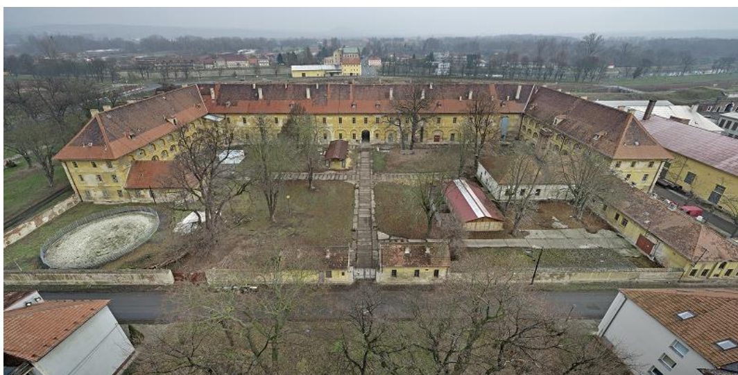
Foto: Nádvoří a budova Vojenské nemocnice v Terezíně

Tato část probíhá venku před budovou. Zde ještě není třeba mít na hlavě zapůjčené přilby.