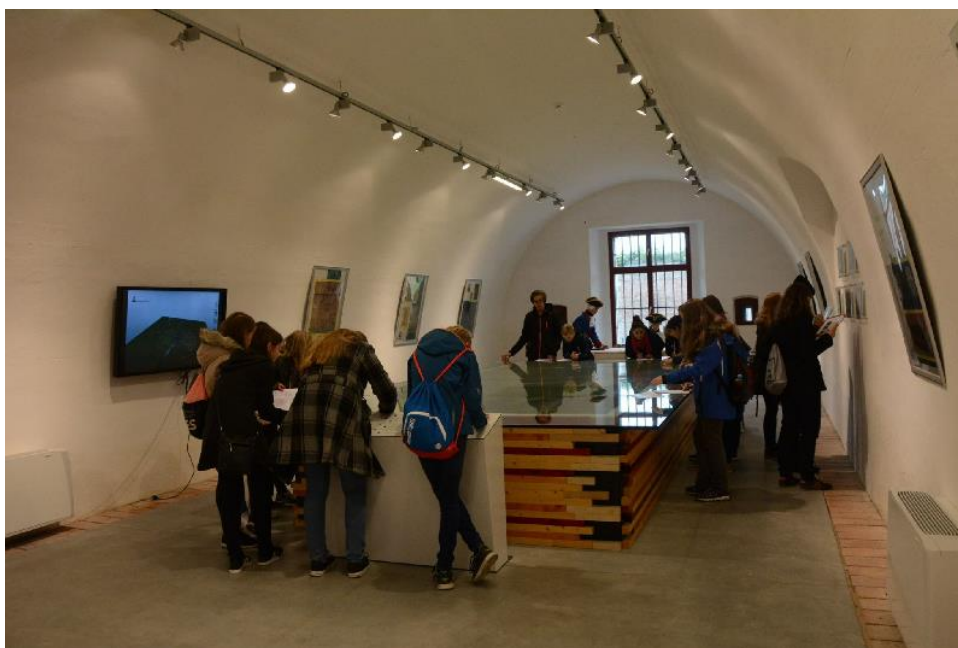
Foto: Účastníci programu při získávání informací v Muzeu Terezína

Při realizaci této části programu jinde než v Terezíně ji lze velmi snadno upravit na aktuální podmínky daného města. Zdejší památky ale byly vybírány s ohledem na zajímavé části historie Terezína (zajatecký tábor na Kavalíru 4 nebo fotbal v době ghetta v Drážďanských/Žižkových kasárnách), nebo na bouřlivé proměny dané budovy. Příkladem budiž Wieserův dům postavený jako šlechtické sídlo a hotel, později ubytovna pro postižené požárem České Lípy, následně coby kasino a ubytování pro vysoké důstojníky, a nakonec v době ghetta sídlo českých četníků hlídajících hranice ghetta. Výběr budov v jiném městě by tedy měl sledovat podobně pohnuté osudy.