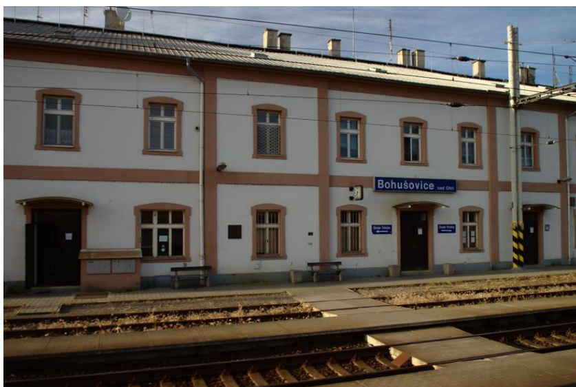
Foto: Budova nádraží v Bohušovicích nad Ohří dnes (zdroj: Wikimedia)

Toto místo je určeno ale spíše pro připomenutí událostí 19. století a zejména války 1866. Nemělo by se tedy zapomenout odprezentovat účastníkům na základě přiloženého plánu, že nádraží bylo svým způsobem „detašovanou pevností“ terezínské pevnosti obklopenou valy, bateriemi a dělostřelectvem.