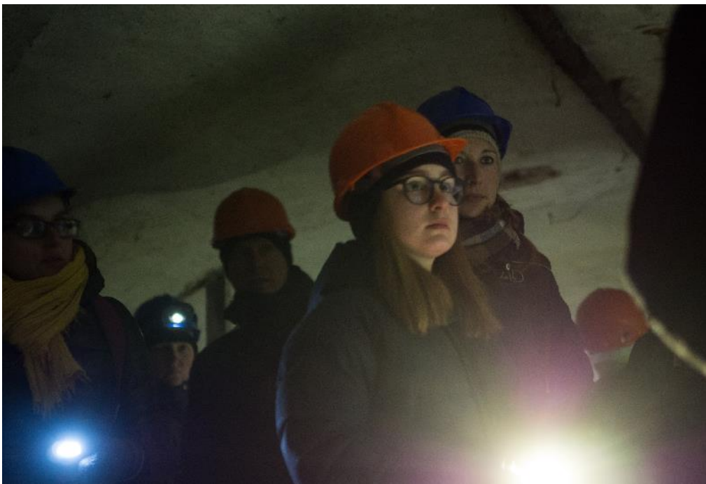
Foto: Účastníci prohlídky nemocnice s bezpečnostními přilbami