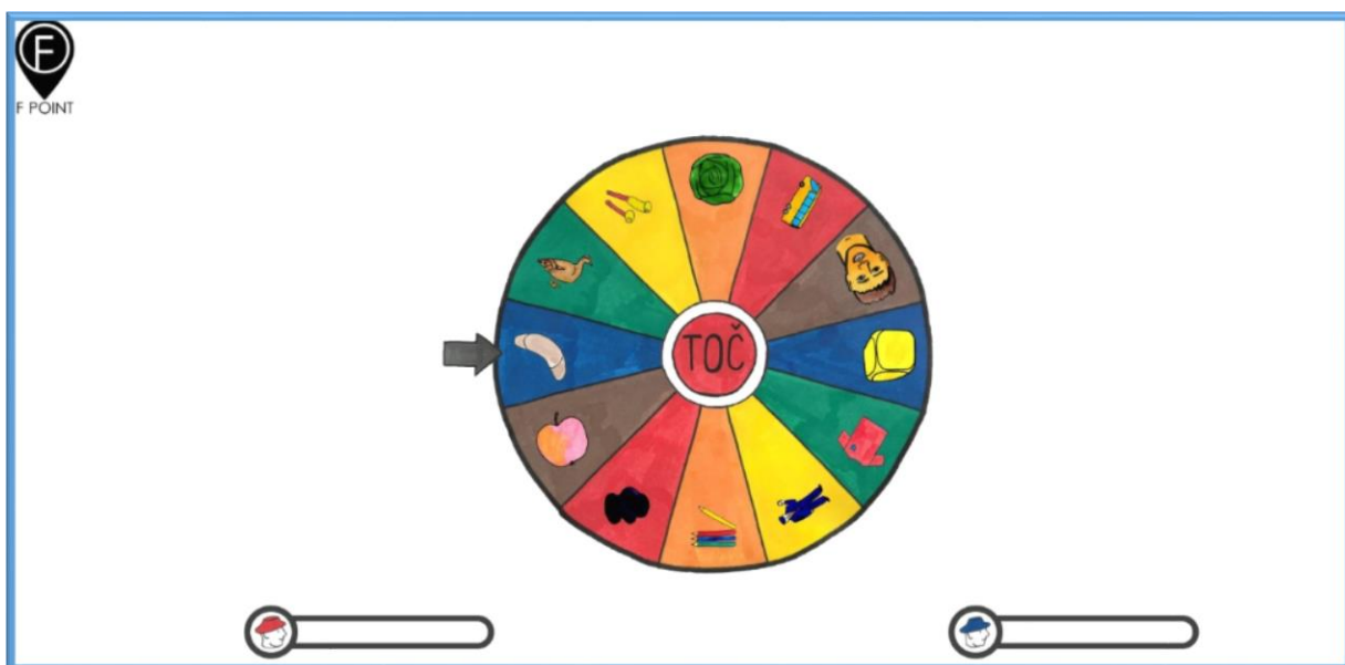
Obrázek 1 Kolo štěstí - začátek hry