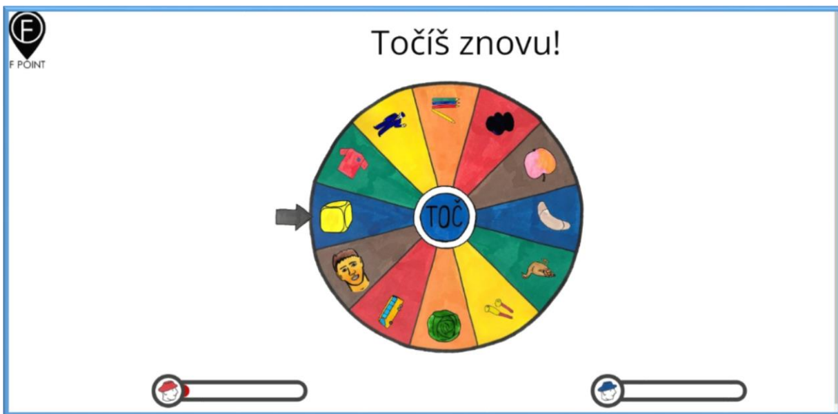
Obrázek 4 Kolo štěstí - Točíš znovu!