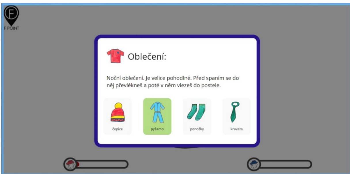
Obrázek 5 Kolo štěstí - Oblečení