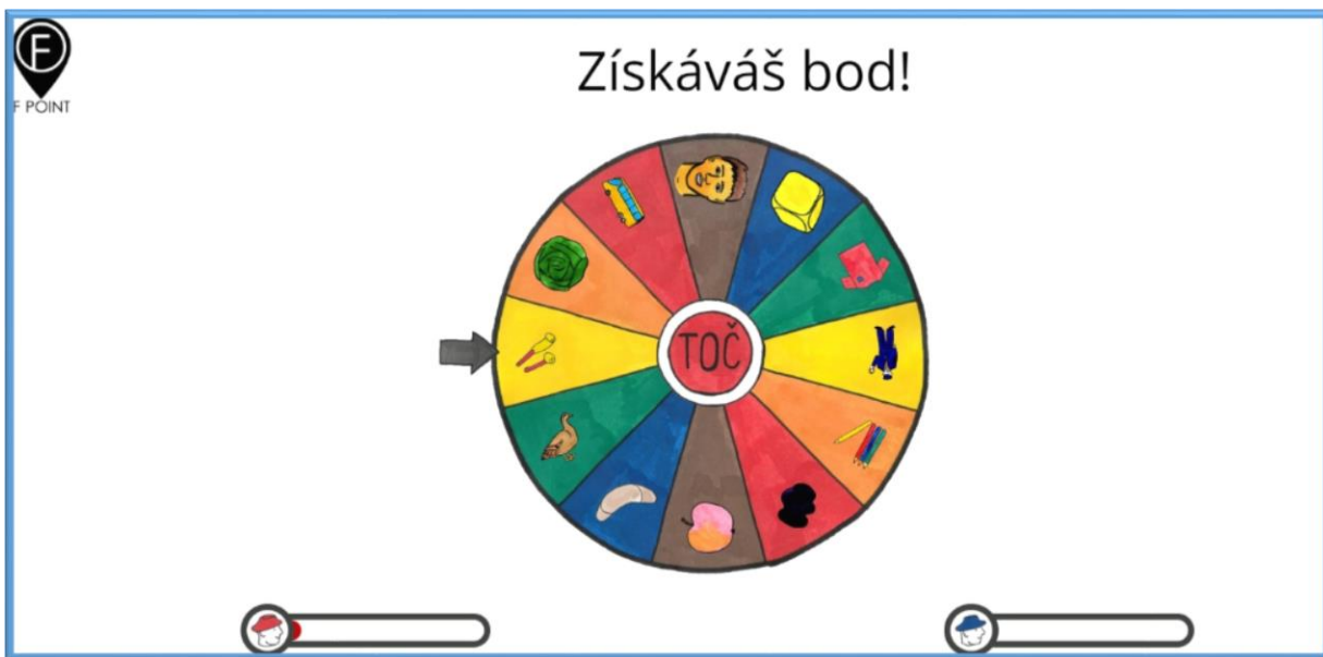
Obrázek 2 Kolo štěstí - Získáváš bod!