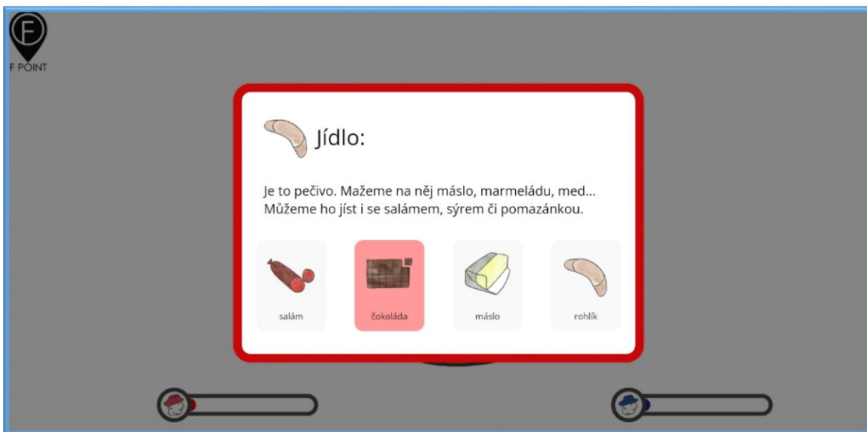
Obrázek 6 Kolo štěstí - Jídlo