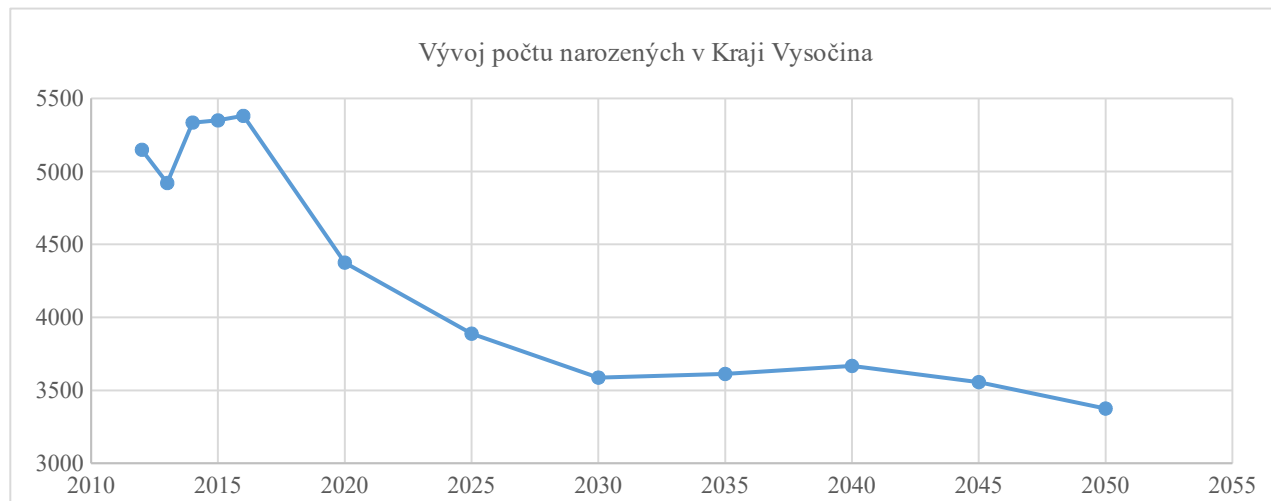
Obrázek 3: Prognóza vývoje narozených v Kraji Vysočina