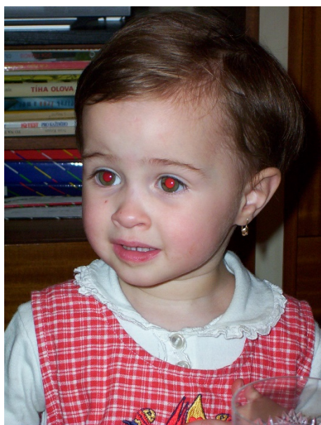
Obr. 7: Úkol – redukce červených očí