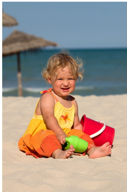
Obr. 6: Úkol 1 - řešení