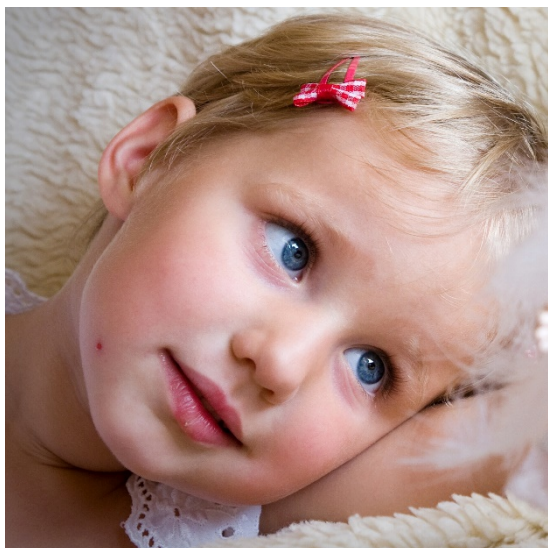
Obr. 3: Klonovací razítko před aplikací