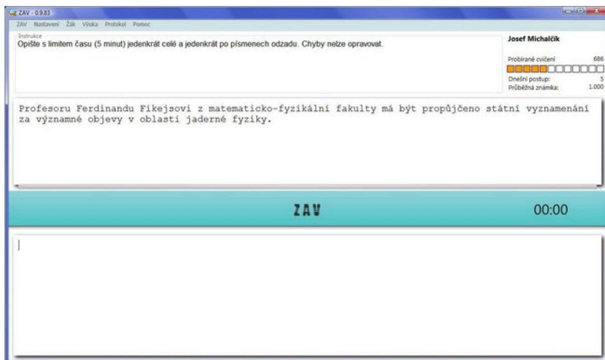
Obr. 1: Ukázka programu ZAV