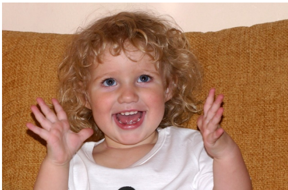
Obr. 1: Červené oči před aplikací