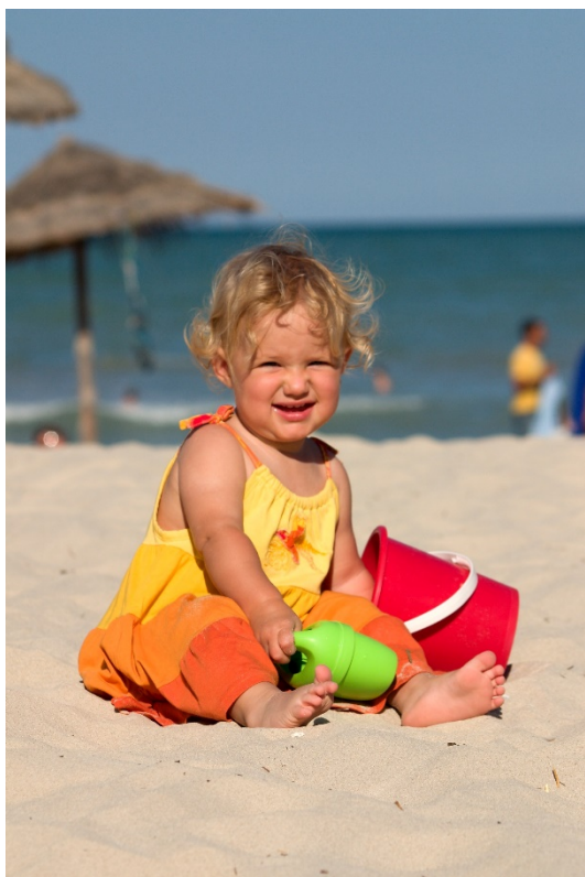
Obr. 5: Úkol 1 – klonovací razítko